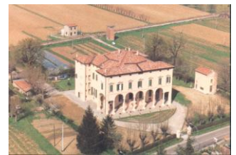
Villa delle Roveri