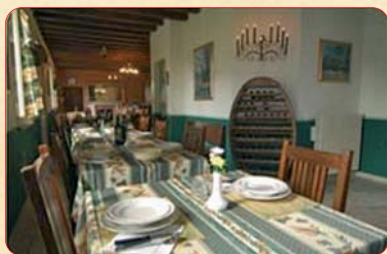
Azienda Agricola Agrituristica